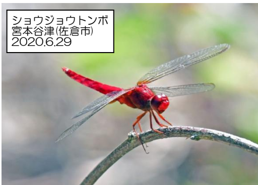
ショウジョウトンボ 宮本谷津(佐倉市) 2020.6.29