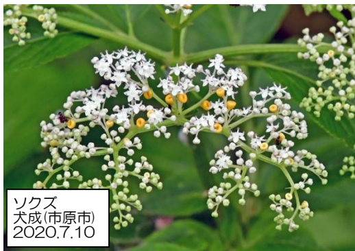
ソクズ 犬成(市原市) 2020.7.10