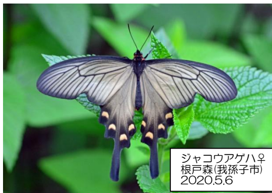
ジャコウアゲハ♀ 根戸森(我孫子市) 2020.5.6