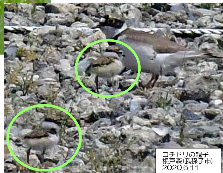
コチドリの親子 根戸森(我孫子市) 2020.5.11