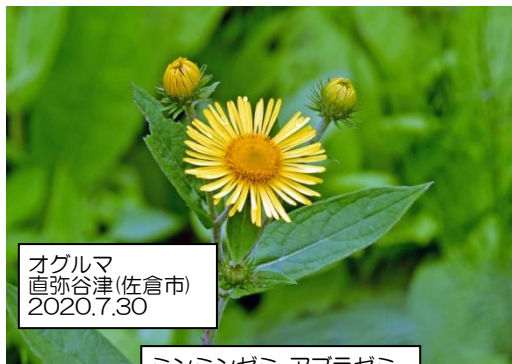
オグルマ 直弥谷津(佐倉市) 2020.7.30