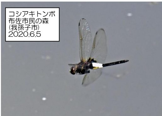
コシアキトンボ 布佐市民の森 (我孫子市) 2020.6.5