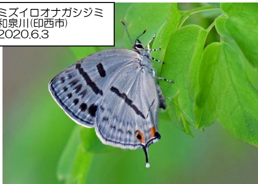
ミズイロオナガシジミ 和泉川(印西市) 2020.6.3