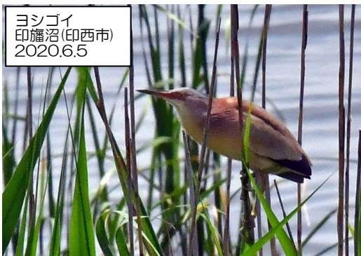
ヨシゴイ 印旛沼(印西市) 2020.6.5