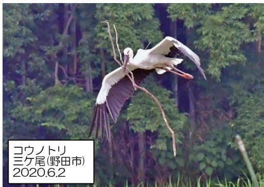
コウノトリ 三ヶ尾(野田市) 2020.6.2