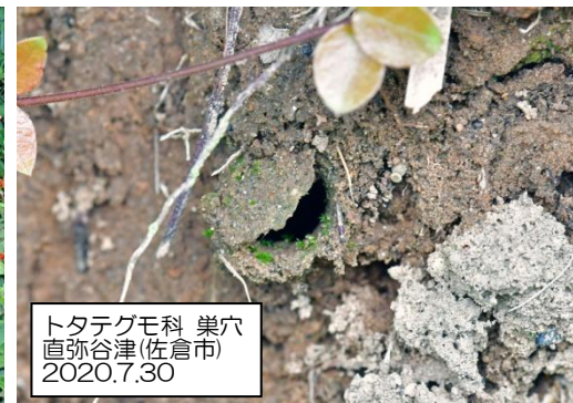
トタテグモ科 巣穴 直弥谷津(佐倉市) 2020.7.30