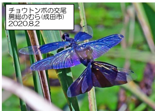
チョウトンボの交尾 房総のむら(成田市) 2020.8.2