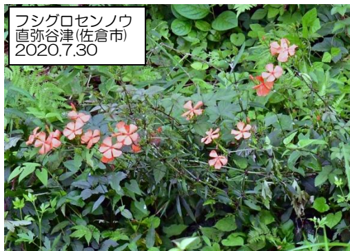
フシグロセンノウ 直弥谷津(佐倉市) 2020.7.30