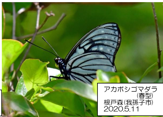
アカボシゴマダラ (春型) 根戸森(我孫子市) 2020.5.11