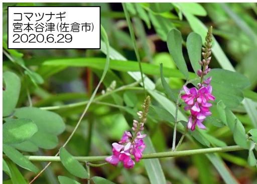
コマツナギ 宮本谷津(佐倉市) 2020.6.29