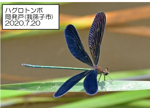
ハグロトンボ 岡発戸(我孫子市) 2020.7.20