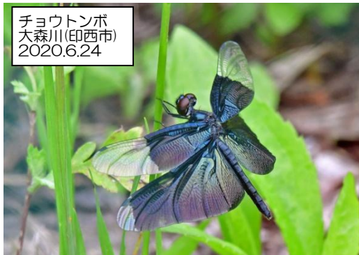
チョウトンボ 大森川(印西市) 2020.6.24