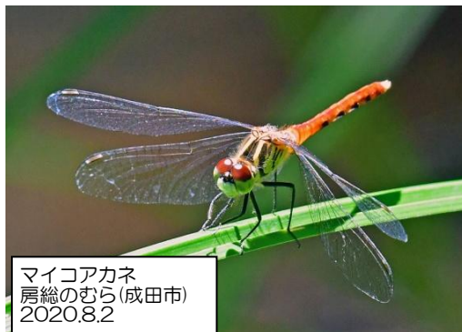
マイコアカネ 房総のむら(成田市) 2020.8.2