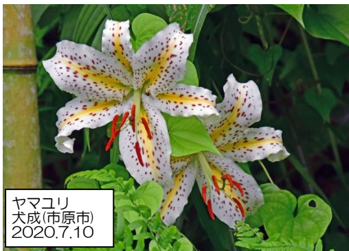
ヤマコリ 犬成(市原市) 2020.7.10