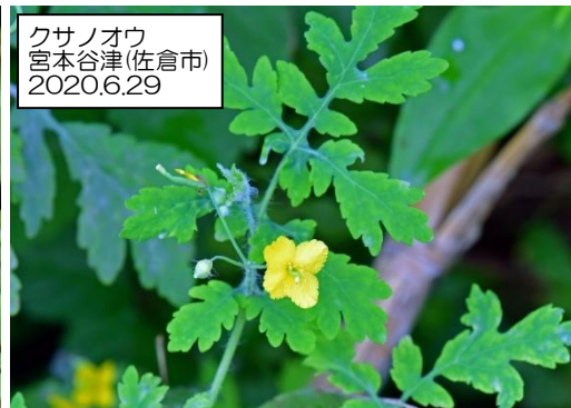
クサノオウ 宮本谷津(佐倉市) 2020.6.29