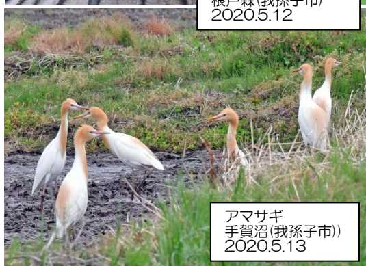
アマサギ 手賀沼(我孫子市) 2020.5.13