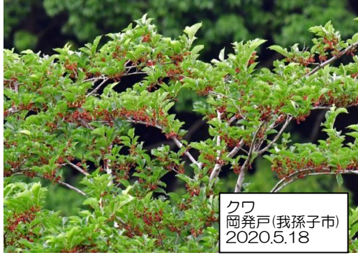
クワ 岡発戸(我孫子市) 2020.5.18