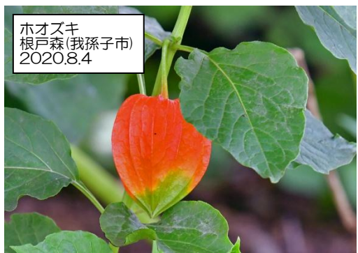
ホオズキ 根戸森(我孫子市) 2020.8.4