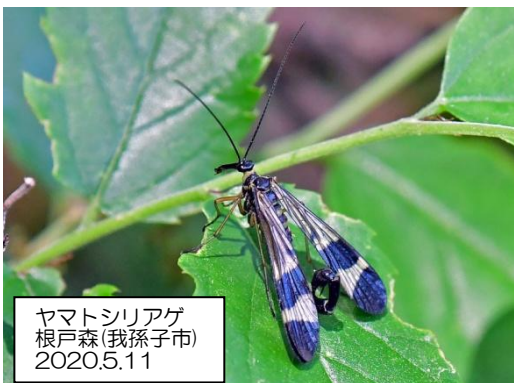
ヤマトシリアゲ 根戸森(我孫子市) 2020.5.11