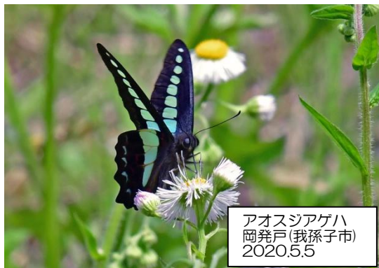
アオスジアゲハ 岡発戸(我孫子市) 2020.5.5