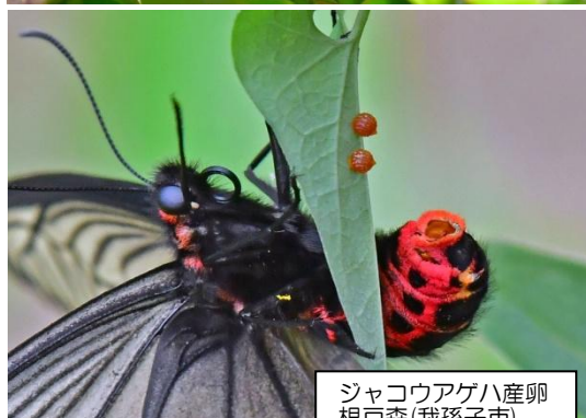
ジャコウアゲハ産卵 根戸森(我孫子市) 2020.5.12