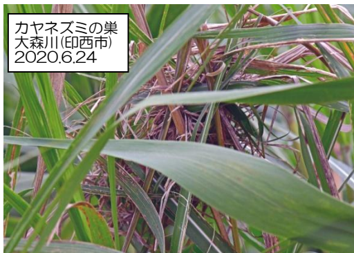
カヤネズミの巣 大森川(印西市) 2020.6.24