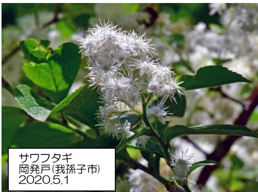
サワフタギ 岡発戸(我孫子市) 2020.5.1