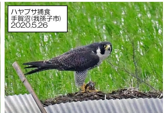
ハヤブサ捕食 手賀沼(我孫子市) 2020.5.26