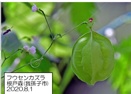
フウセンカズラ 根戸森(我孫子市) 2020.8.1