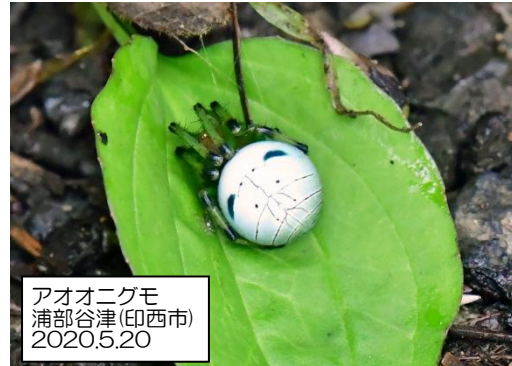
アオオニグモ 浦部谷津(印西市) 2020.5.20