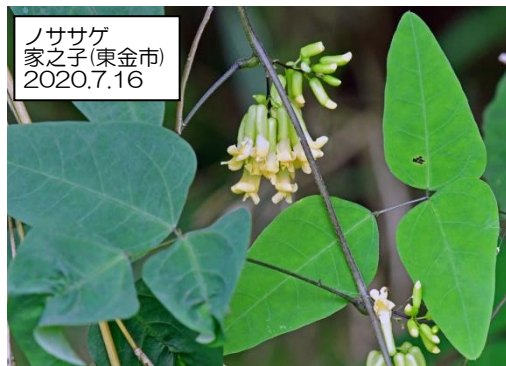
ノササゲ 家之子(東金市) 2020.7.16