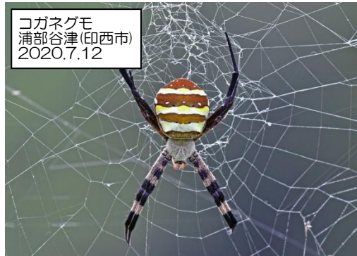
コガネグモ 浦部谷津(印西市) 2020.7.12