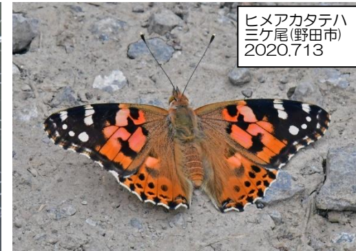
ヒメアカタテハ 三ヶ尾(野田市) 2020.7.13