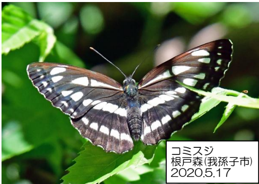
コミスジ 根戸森(我孫子市) 2020.5.17