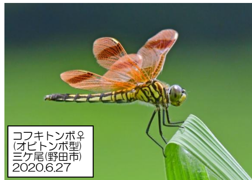
コフキトンボ♀ (オビトンボ型) 三ヶ尾(野田市) 2020.6.27