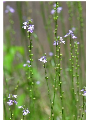
マツバウンラン 根戸森(我孫子市) 2020.5.11