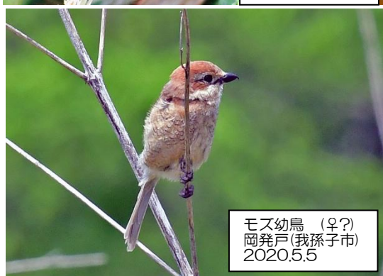
モズ幼鳥 (♀?) 岡発戸(我孫子市) 2020.5.5