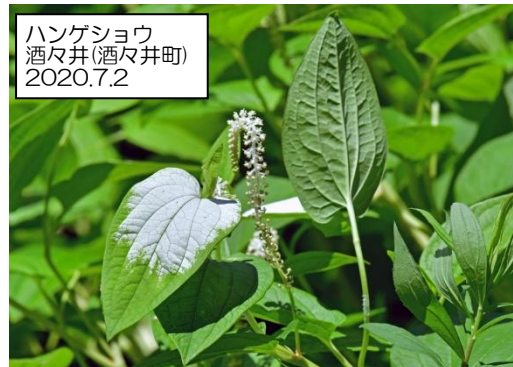
ハンゲショウ 酒々井(酒々井町) 2020.7.2