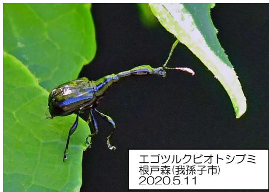
エゴツルクビオトシブミ 根戸森(我孫子市) 2020.5.11