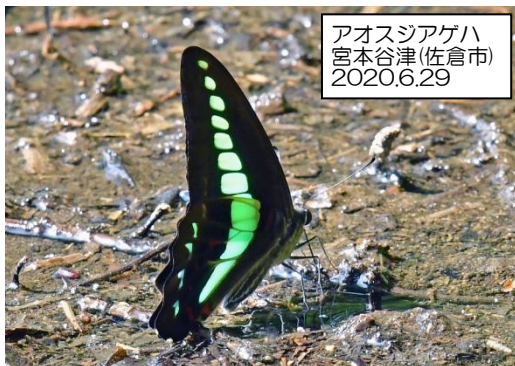
アオスジアゲハ 宮本谷津(佐倉市) 2020.6.29