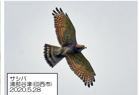
サシバ 浦部谷津(印西市) 2020.5.28