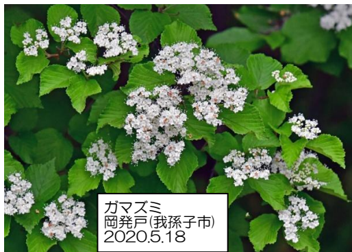
ガマズミ 岡発戸(我孫子市) 2020.5.18