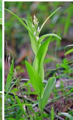
ササバギンラン 根戸森(我孫子市) 2020.5.6