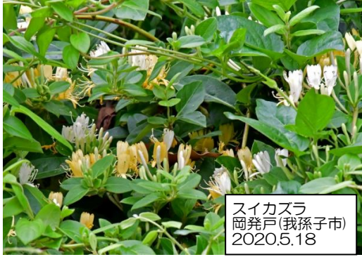
スイカズラ 岡発戸(我孫子市) 2020.5.18