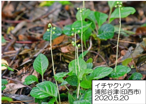
イチヤクソウ 浦部谷津(印西市) 2020.5.20