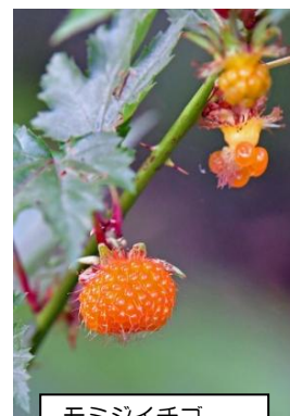
モミシイチゴ 根戸森(我孫子市) 2020.5.11