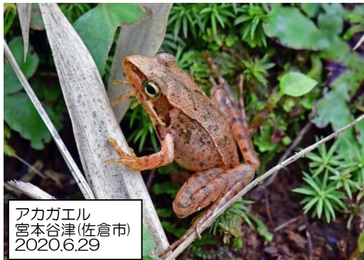
アカガエル 宮本谷津(佐倉市) 2020.6.29