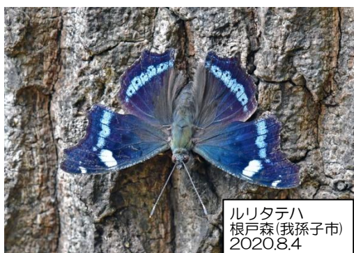
ルリタテハ 根戸森(我孫子市) 2020.8.4