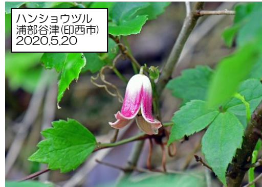
ハンショウツル 浦部谷津(印西市) 2020.5.20