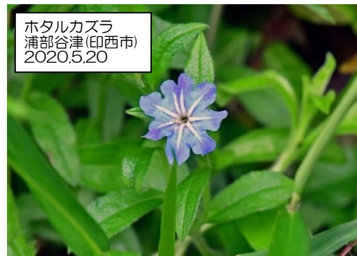
ホタルカズラ 浦部谷津(印西市) 2020.5.20