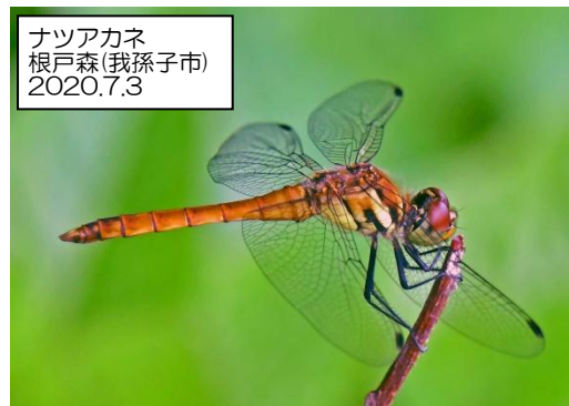
ナツアカネ 根戸森(我孫子市) 2020.7.3

1年で最も昼が長く、夜が長い。 太陽が最も高くなり日差しが強い時期。とはいえ梅雨の最中で日照時間は短い。