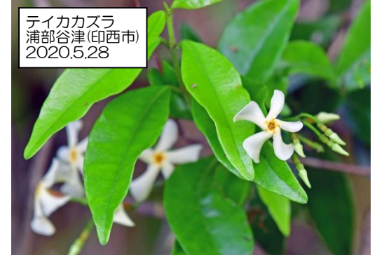
デイカズラ 浦部谷津(印西市) 2020.5.28