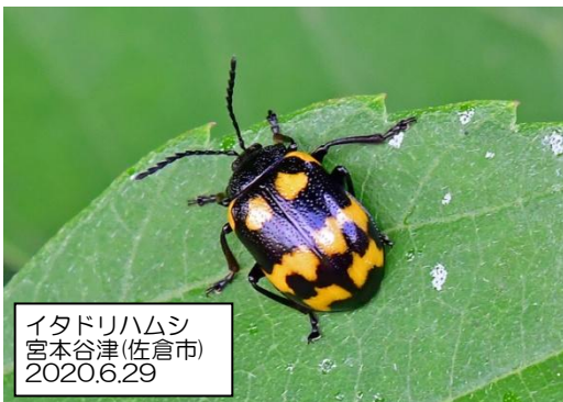
イタドリハムシ 宮本谷津(佐倉市) 2020.6.29