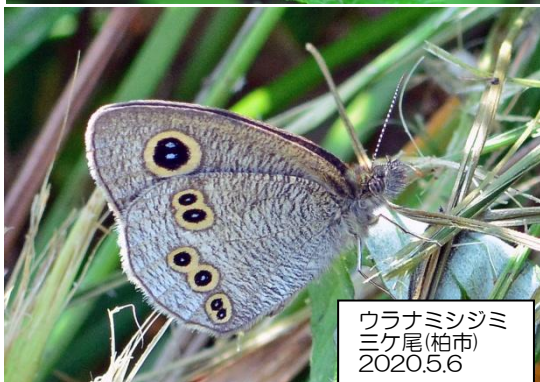
ウラナミシジミ ミケ尾(柏市) 2020.5.6