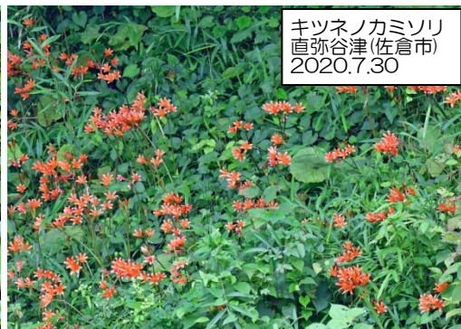
キツネノカミソリ 直弥谷津(佐倉市) 2020.7.30