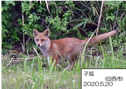
子狐 (印西市) 2020.5.20