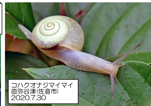
コハクオナジマイマイ 直弥谷津(佐倉市) 2020.7.30