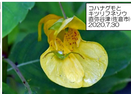
コハナグモと キツリフネソウ 直弥谷津(佐倉市) 2020.7.30