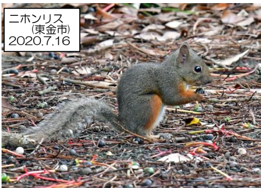
ニホンリス (東金市) 2020.7.16