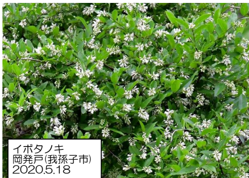
イボタノキ 岡発戸(我孫子市) 2020.5.18