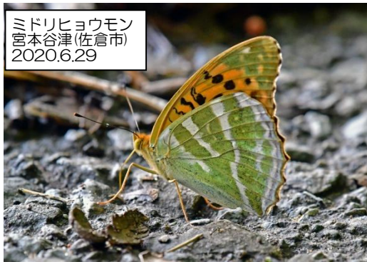
ミドリヒョウモン 宮本谷津(佐倉市) 2020.6.29