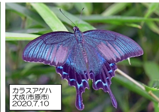
カラスアゲハ 犬成(市原市) 2020.7.10