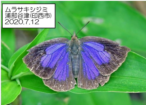
ムラサキシジミ 浦部谷津(印西市) 2020.7.12