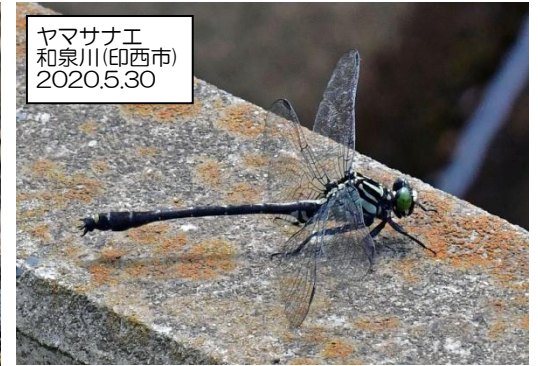
ヤマサナエ 和泉川(印西市) 2020.5.30