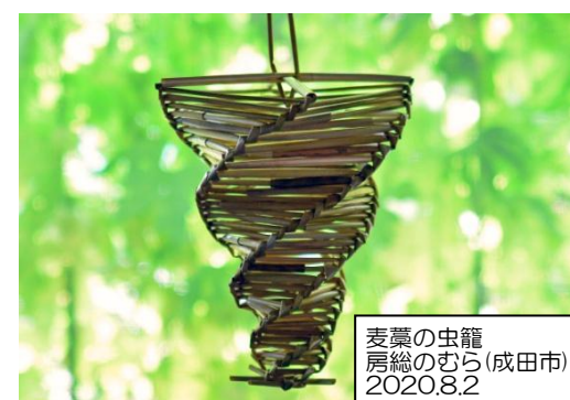
麦藁の虫籠 房総のむら(成田市) 2020.8.2

1年で最も暑い真夏。ぎらぎらと晴天の続くころ。土用のうなぎ、西瓜、風鈴、花火、蛭狩り、ねぶた、竿燈、風物詩が目白押し