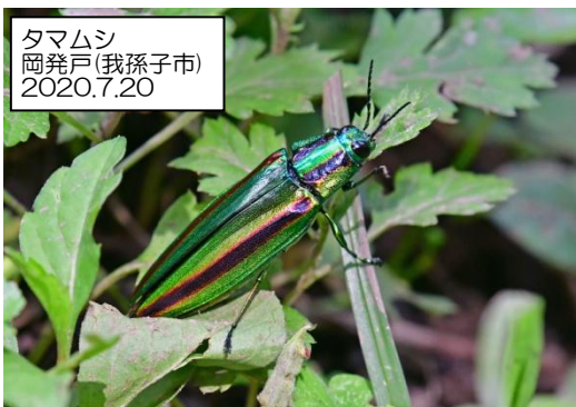
タマムシ 岡発戸(我孫子市) 2020.7.20