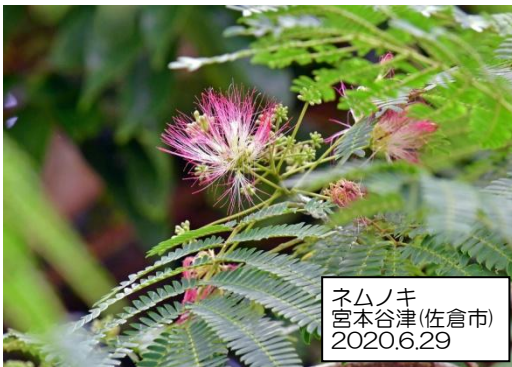
ネムノキ 宮本谷津(佐倉市) 2020.6.29