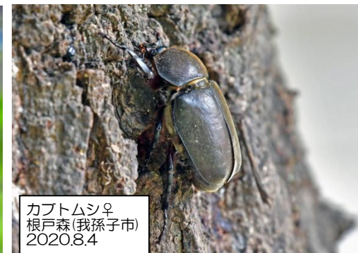
カブトムシ♀ 根戸森(我孫子市) 2020.8.4