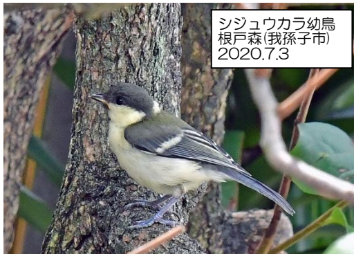
シジウカラ幼鳥 根戸森(我孫子市) 2020.7.3