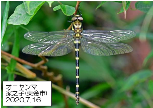
オニヤンマ 家之子(東金市) 2020.7.16