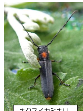
キクスイカミキリ 根戸森(我孫子市) 2020.4.30