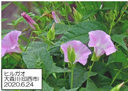
ヒルガオ 大森川(印西市) 2020.6.24