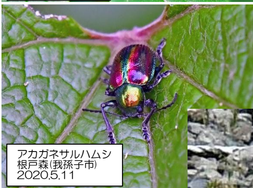
アカガネサルハムシ 根戸森(我孫子市) 2020.5.11