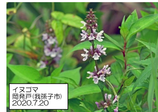
イヌゴマ 岡発戸(我孫子市) 2020.7.20