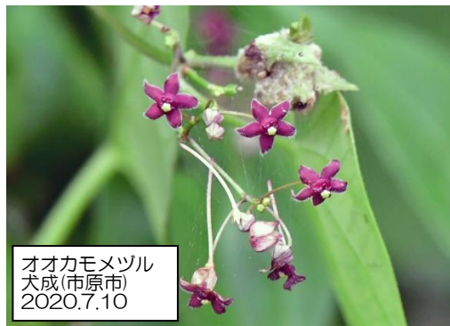
オオカモメツル 犬成(市原市) 2020.7.10