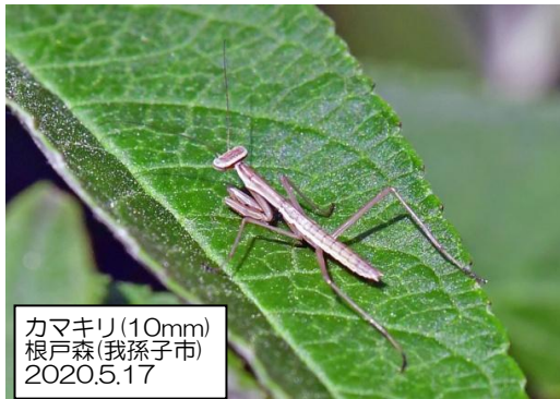
カマキリ(10mm) 根戸森(我孫子市) 2020.5.17