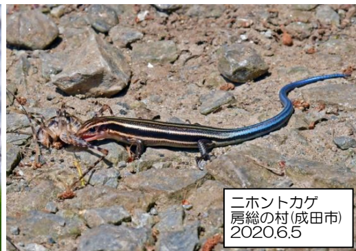
ニホントカゲ 房総の村(成田市) 2020.6.5