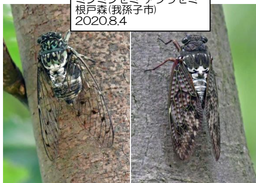
ミンミンゼミ・アブラゼミ 根戸森(我孫子市) 2020.8.4