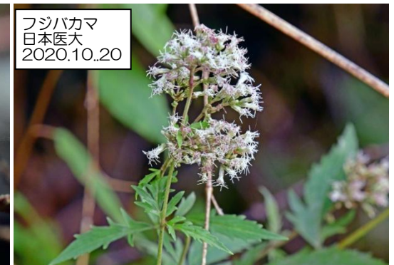
フジバカマ 日本医大 2020.10.20