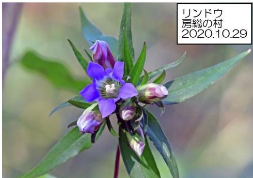
リンドウ 房総の村 2020.10.29