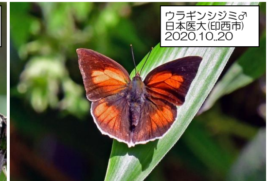
ウラギンシジミ 日本医大(印西市) 2020.10.20