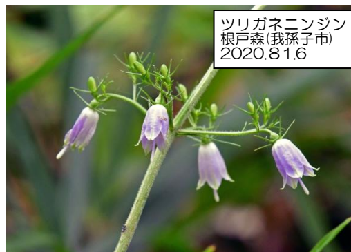
ツリガネニンジン 根戸森(我孫子市) 2020.8.1.6