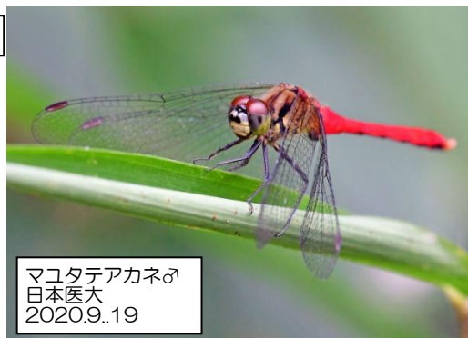
マユタテアカネ 日本医大 2020.9.19