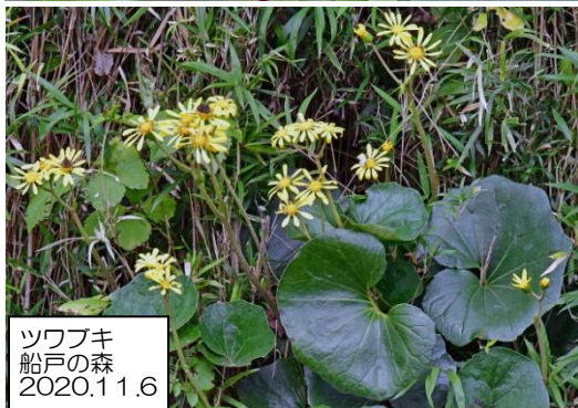
ツツフキ 船戸の森 2020.11.6