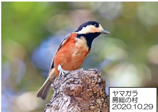
ヤマガラ 房総の村 2020.10.29