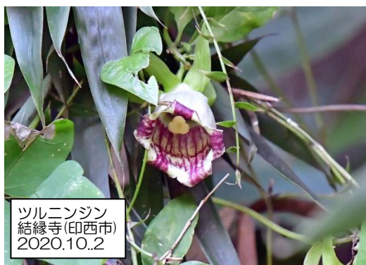
ツルニンジン 結縁寺(印西市) 2020.10..2