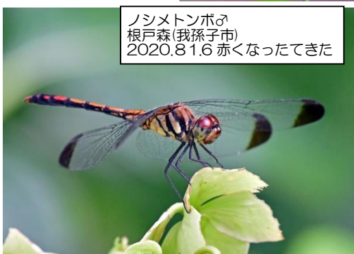
ノシメトンボ 根戸森(我孫子市) 2020.8.1.6 赤くなったてきた