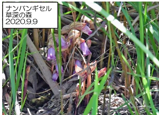
ナンバンギセル 草深の森 2020.9.9