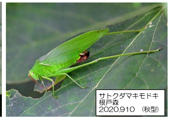
サトクダマキモドキ 根戸森 2020.9.10 (秋型)