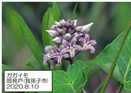
ガガイモ 岡発戸(我孫子市) 2020.8.10