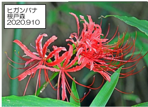
ヒガンバナ 根戸森 2020.9.10