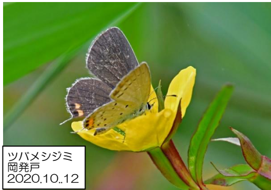
ツバメシジミ 岡発戸 2020.10.12