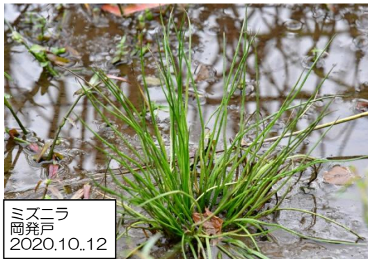
ミズニラ 岡発戸 2020.10.12