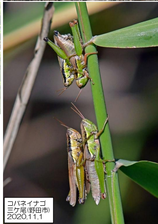
コバネイナゴ ミケ尾(野田市) 2020.11.1