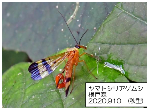
ヤマトシリアゲムシ 根戸森 2020.9.10 (秋型)