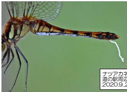
ナツアカネの産卵 道の駅周辺 2020.9..27