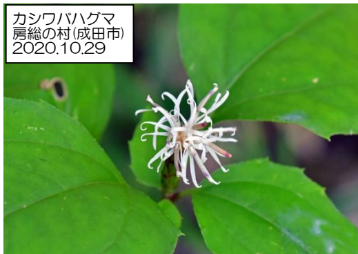
カシワバハグマ 房総の村(成田市) 2020.10.29