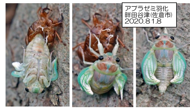
アブラゼミ羽化 畔田谷津(佐倉市) 2020.8.1.8

8月7日～8月22日 暦上では秋であるが暑い盛り。 お盆のとき。残暑見舞い。 ツクツクボウシ、ヒグラシ