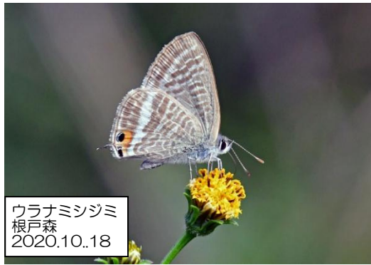
ウラナミシジミ 根戸森 2020.10.18