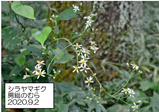
シラヤマギク 房総のむら 2020.9.2