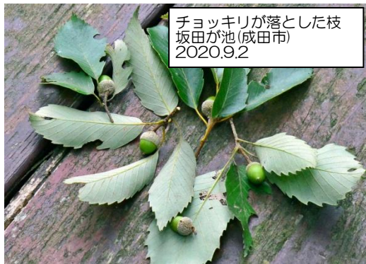
チョッキリが落とした枝 坂田が池(成田市) 2020.9.2