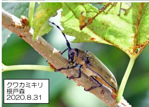
クワカミキリ 根戸森 2020.8.31