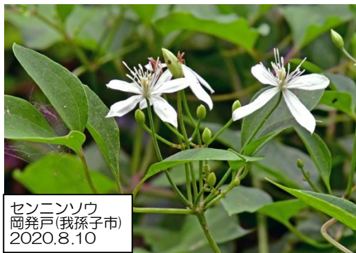
センニンソウ 岡発戸(我孫子市) 2020.8.10