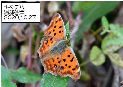
キタテハ 浦部谷津 2020.10.27