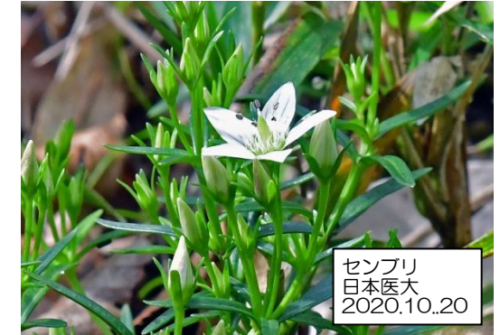
センブリ 日本医大 2020.10.20

＜朝露が寒さで凍って霜になる直前の状態。空気が澄んで清しい秋晴れの日が多くなる＞