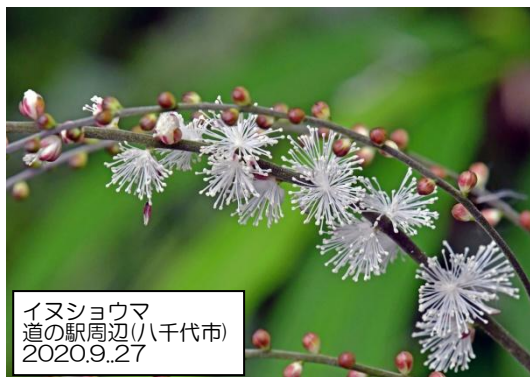
イヌショウマ 道の駅周辺(八千代市) 2020.9..27