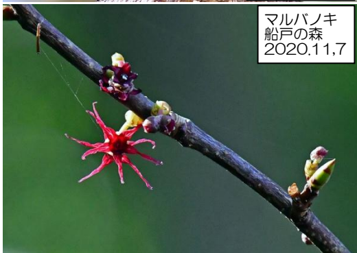
マルバノキ 船戸の森 2020.11.7