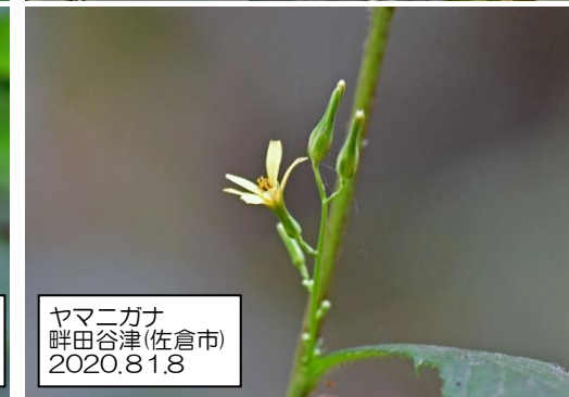
ヤマニガナ 畔田谷津(佐倉市) 2020.8.1.8