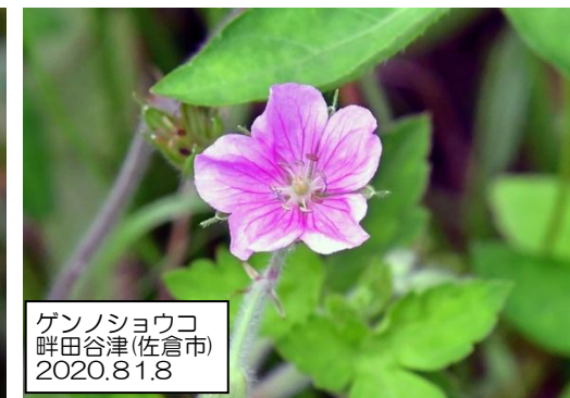
ゲンノショウコ 畔田谷津(佐倉市) 2020.8.1.8