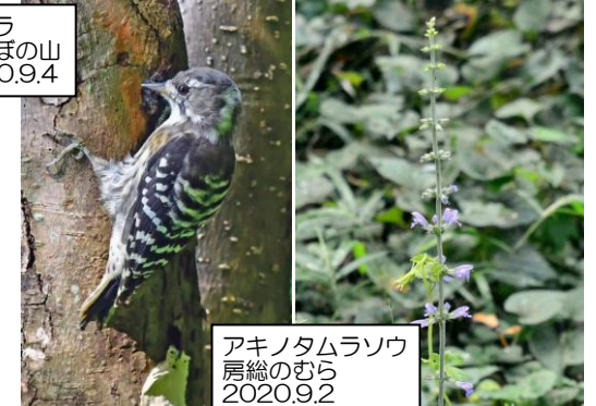
アキノタムラソウ 房総のむら 2020.9.2