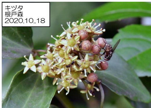
キツタ 根戸森 2020.10.18