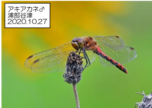
アキアカネ 浦部谷津 2020.10.27