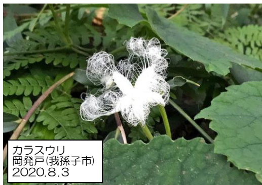
カラスウリ 岡発戸(我孫子市) 2020.8.3