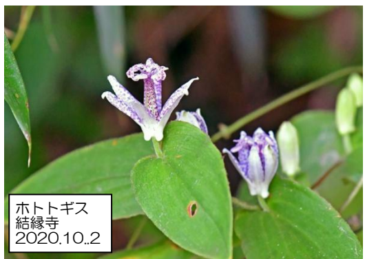
ホトトギス 結縁寺 2020.10..2