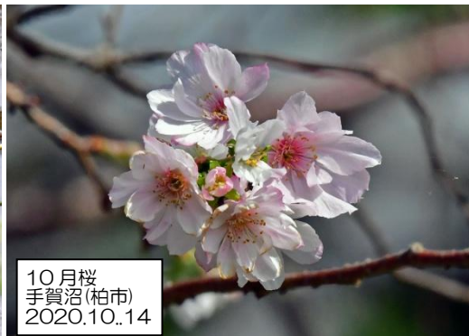
10月桜 手賀沼(柏市) 2020.10.14