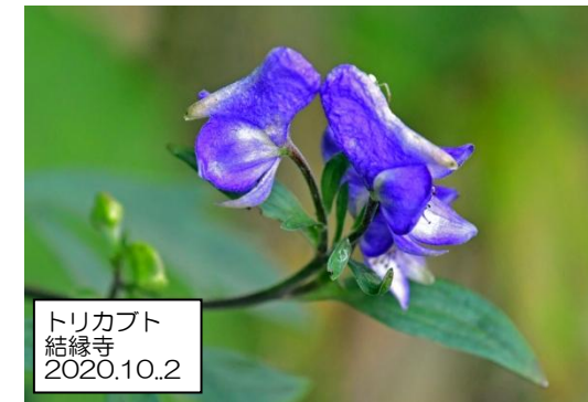
トリカブト 結縁寺 2020.10..2

＜「暑さ寒さは彼岸まで」秋の彼岸では残暑が収まる。日が短くなり秋が深まる＞ 中秋の名月、お団子、栗、梨、柿、稲穂、秋の実、キンモクセイノスリ、モズ虫の鳴き声、赤トンボ