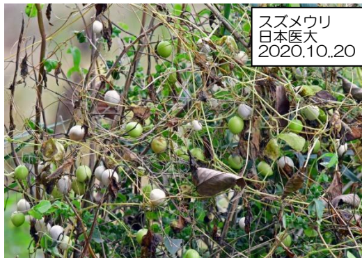
スズメウリ 日本医大 2020.10.20