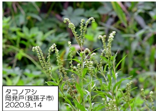
タコノアシ 岡登戸(我孫子市) 2020.9.14