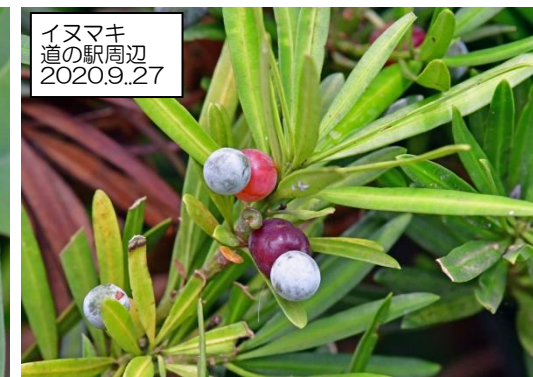
イヌマキ 道の駅周辺 2020.9..27