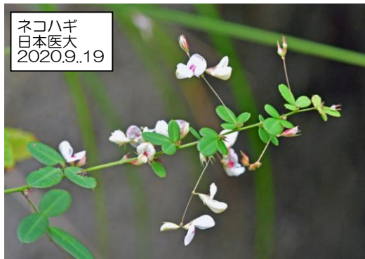
ネコハギ 日本医大 2020.9.19