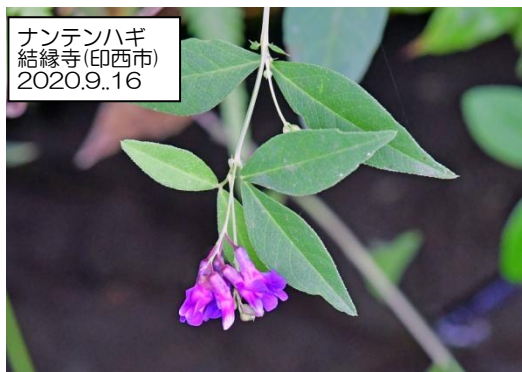
ナンテンハギ 結縁寺(印西市) 2020.9.16