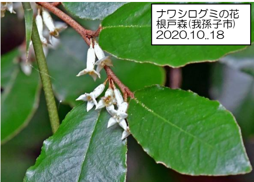
ナワシログミの花 根戸森(我孫子市) 2020.10.18