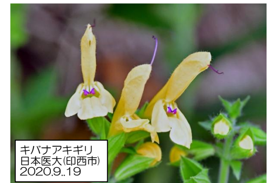
キバナアキギリ 日本医大(印西市) 2020.9.19