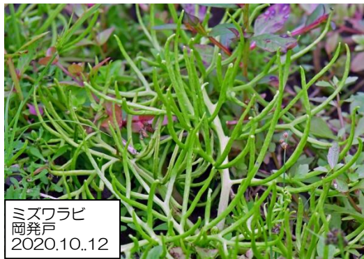
ミズワラビ 岡発戸 2020.10.12