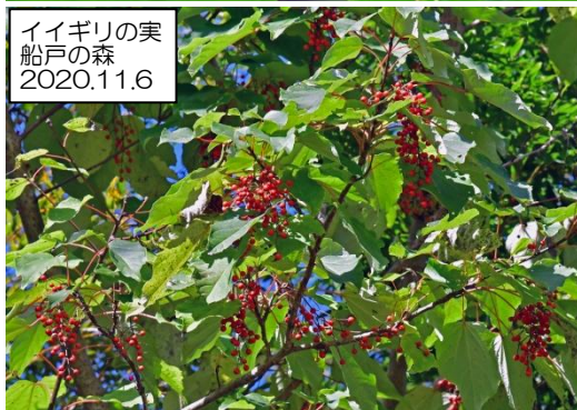
イイギリの実 船戸の森 2020.11.6