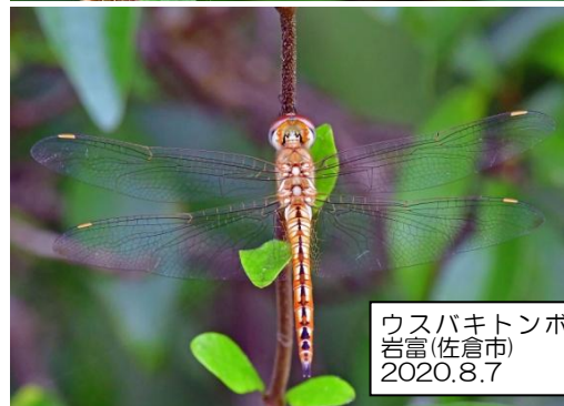
ウスバキトンボ 岩富(佐倉市) 2020.8.7