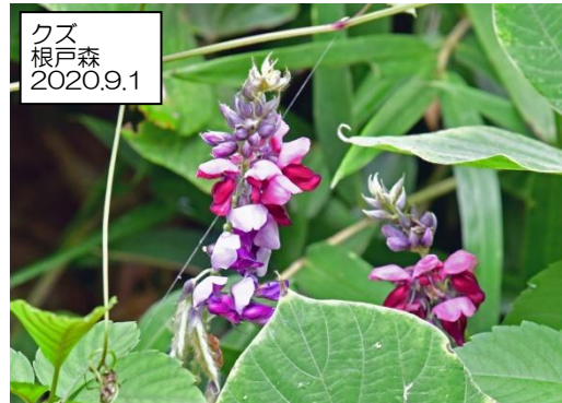
クズ 根戸森 2020.9.1