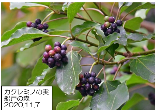
カクレミノの実 船戸の森 2020.11.7