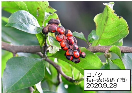
コブシ 根戸森(我孫子市) 2020.9..28