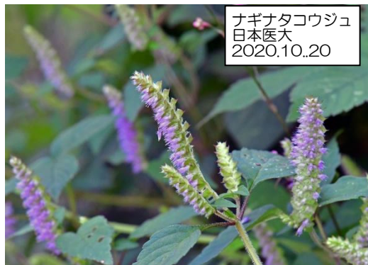
ナギナタコウジュ 日本医大 2020.10.20