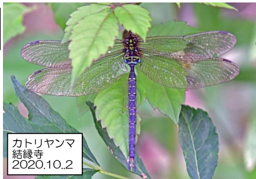
カトリヤンマ 結縁寺 2020.10..2