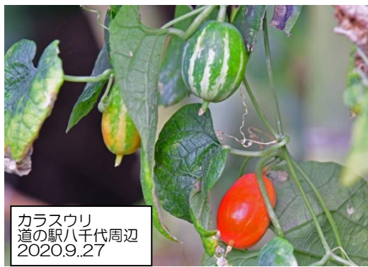
カラスウリ 道の駅八千代周辺 2020.9..27