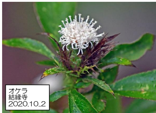
オケラ 結縁寺 2020.10..2