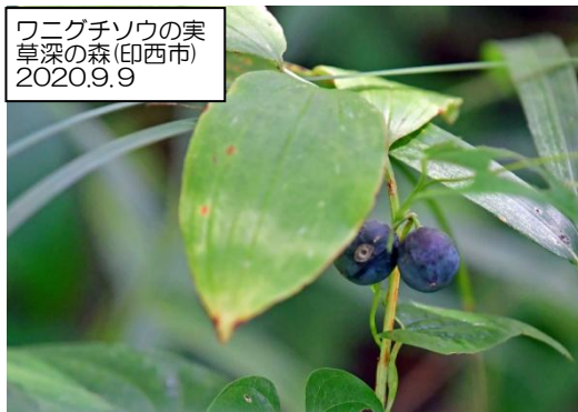
ワニグチソウの実 草深の森(印西市) 2020.9.9