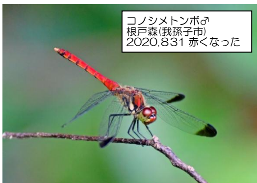
コノシメトンボみ 根戸森(我孫子市) 2020.8.31 赤くなった