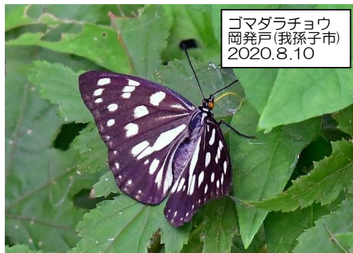
ゴマダラチョウ 岡発戸(我孫子市) 2020.8.10