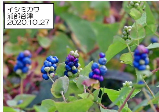
イシミカワ 浦部谷津 2020.10.27