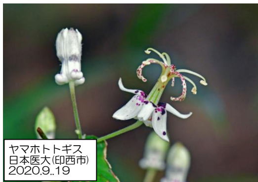
ヤマホトトギス 日本医大(印西市) 2020.9.19