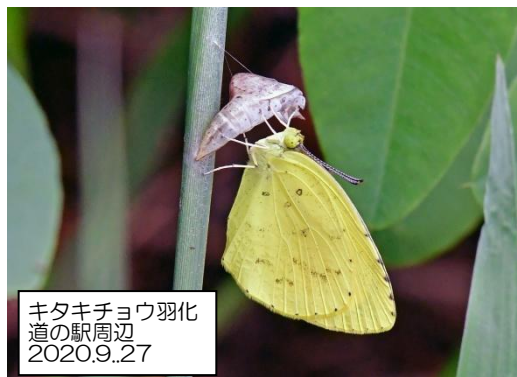
キタキチョウ羽化 道の駅周辺 2020.9..27