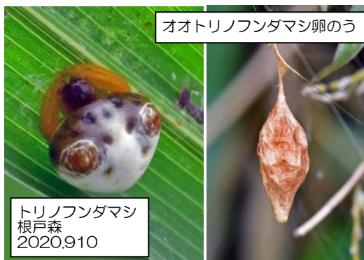
オオトリノフンダマシ卵のう