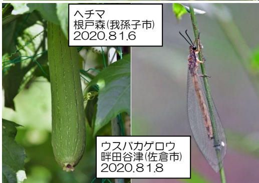
ヘチマ 根戸森(我孫子市) 2020.8.1.6