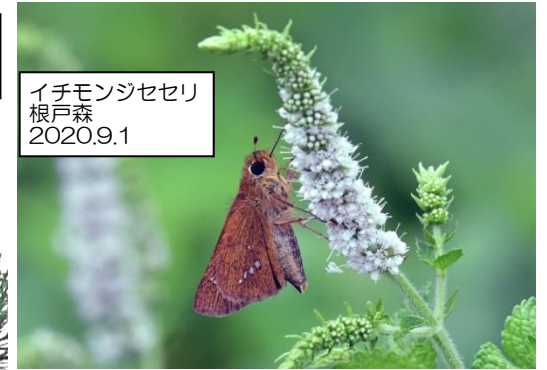
イチモンジセセリ 根戸森 2020.9.1