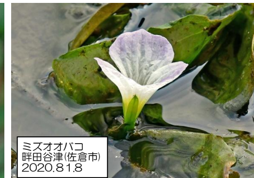
ミスオオバコ 畔田谷津(佐倉市) 2020.8.1.8