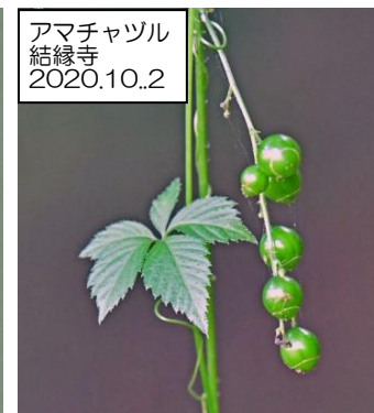
アマチャツル 結縁寺 2020.10..2