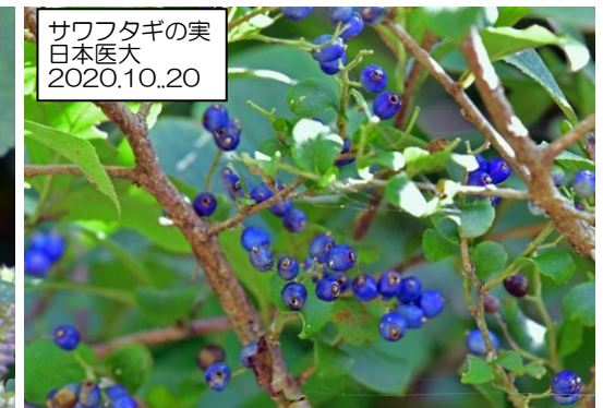
サウフタギの実 日本医大 2020.10.20