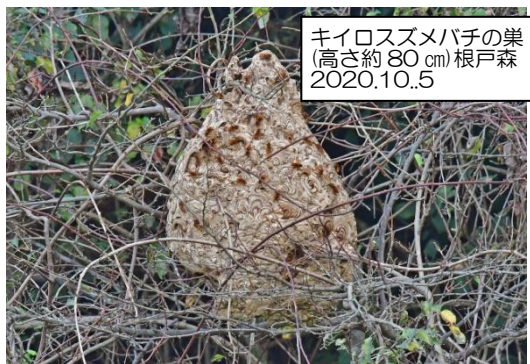
キイロスズメバチの巣 (高さ約 80 cm) 根戸森 2020.10..5