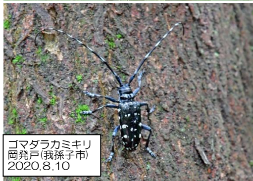
ゴマダラカミキリ 岡発戸(我孫子市) 2020.8.10