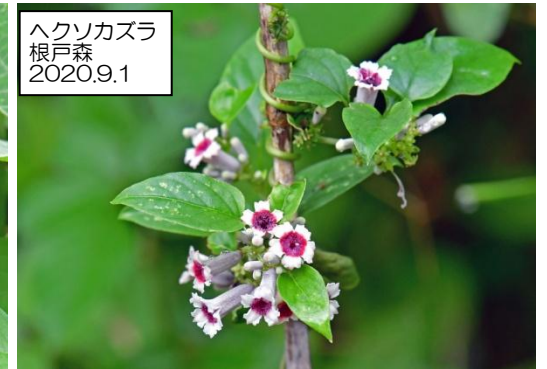
ヘクソカズラ 根戸森 2020.9.1