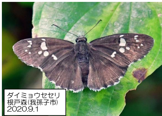
ダイミョウセセリ 根戸森(我孫子市) 2020.9.1