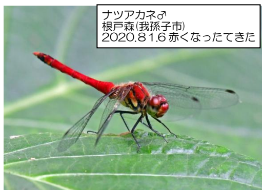
ナツアカネ 根戸森(我孫子市) 2020.8.1.6 赤くなったてきた