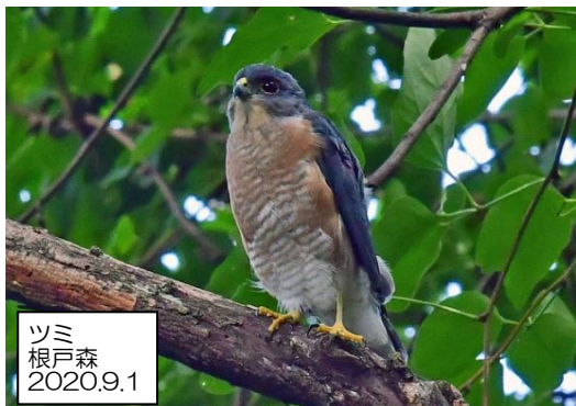
ツミ 根戸森 2020.9.1