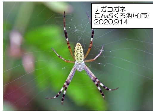
ナガコガネ こんぶくろ池(柏市) 2020.9.14