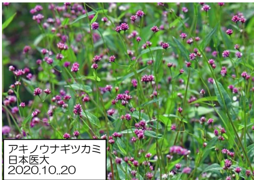
アキノウナギツカミ 日本医大 2020.10.20