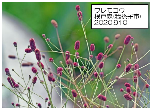
フレモコウ 根戸森(我孫子市) 2020.9.10