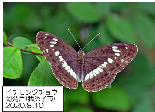
イチモンジチョウ 岡発戸(我孫子市) 2020.8.10