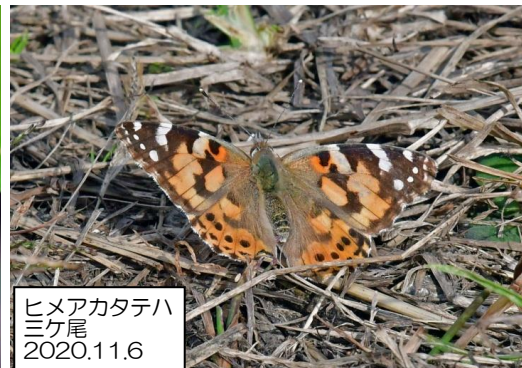
ヒメアカタテハ ミケ尾 2020.11.6