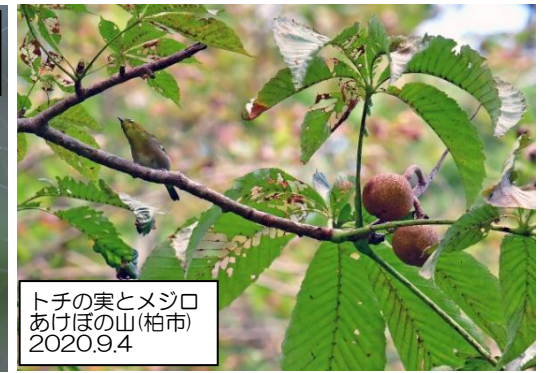
トチの実とメジロ あけほの山(柏市) 2020.9.4