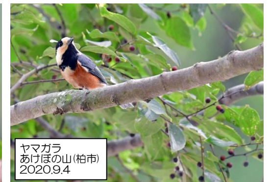
ヤマガラ あけほの山(柏市) 2020.9.4