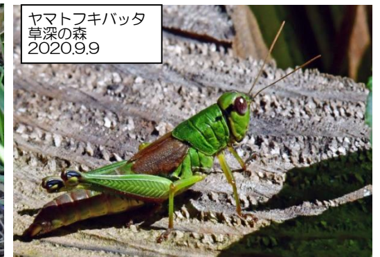
ヤマトフキバッタ 草深の森 2020.9.9