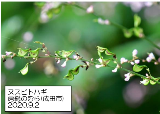
ヌスビトハギ 房総のむら(成田市) 2020.9.2