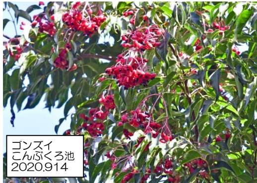
ゴンズイ こんぶくろ池 2020.9.14