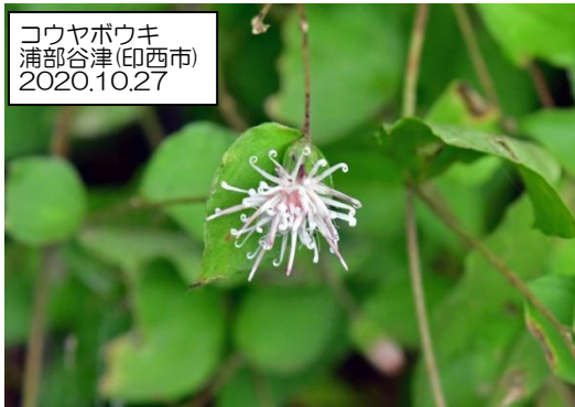
コウヤボウキ 浦部谷津(印西市) 2020.10.27