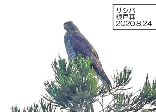
サシバ 根戸森 2020.8.24