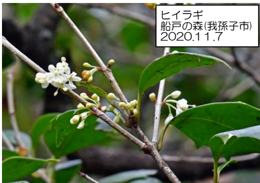
ヒイラギ 船戸の森(我孫子市) 2020.11.7